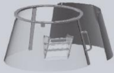
Фиксированный вращающийся пластиковый предохранитель на "F"