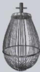
Венчик из тонкой проволоки